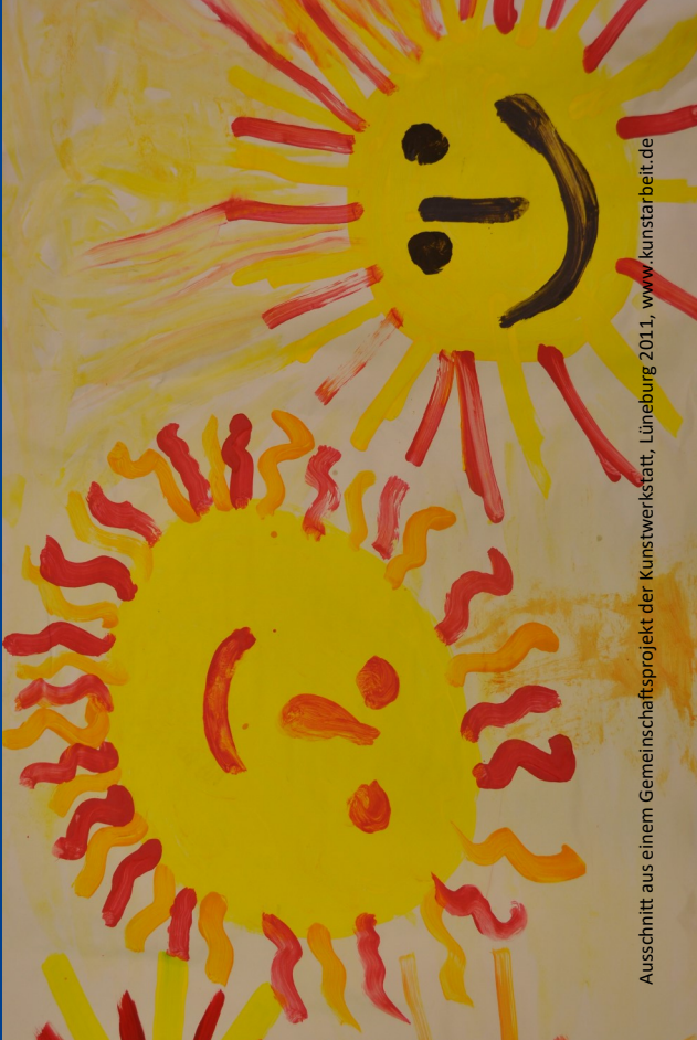
Ausschnitt aus einem Gemeinschaftsprojekt der Kunstwerkstatt, Lüneburg 2011, www.kunstarbeit.de