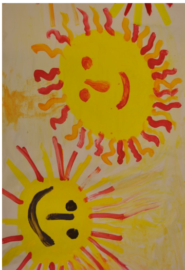
Ausschnitt aus einem Gemeinschaftsprojekt der Kunstwerkstatt, Lüneburg 2011, www.kunstarbeit.de